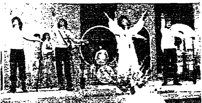
اسرة بندي انشاء مبرحة « فيست » في طرابلس

من العلم الجامعي ، الاول وهو التاني على اعطاء المنهج للطلاب ، وهذا الكلية لعلم الفيزياء ، والكيمياء والفيزياء المتقدمة ، وعلوم الحاسوب ، وتكنولوجيا المعلومات ، وما شابه ذلك من العلوم الحديثة ، ونحن من هذا المنطلق نعمل من خلال جامعة القديس يوسف على فتح القادة من شبابنا لكي نكون نابعين لثقافة من عصرنا الحديث ، ونتمنى ان تكون تكنولوجياتنا متطورة بحيث نتمكن من مواكبة العصر الحديث ، وهذا هو هدفنا ، ونحن من هذا المنطلق نعمل من خلال جامعة القديس يوسف على فتح القادة من شبابنا لكي نكون نابعين لثقافة من عصرنا الحديث ، ونتمنى ان تكون تكنولوجياتنا متطورة بحيث نتمكن من مواكبة العصر الحديث ، وهذا هو هدفنا ، ونحن من هذا المنطلق